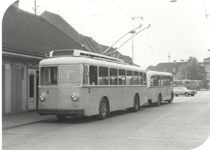
Trolleybus pendant 24 ans