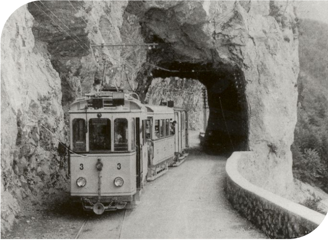
Tram pendant 45 ans