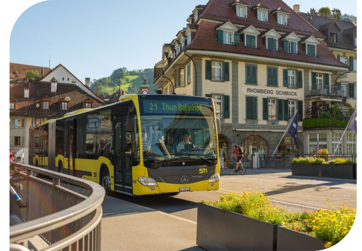
Jusqu'à fin 2025: flotte entièrement constituée de bus diesel