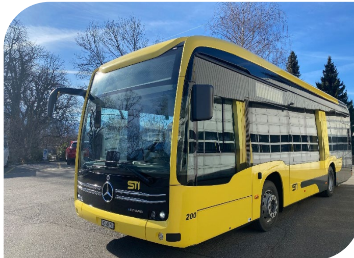
Dès 2036: flotte entièrement constituée de bus électriques