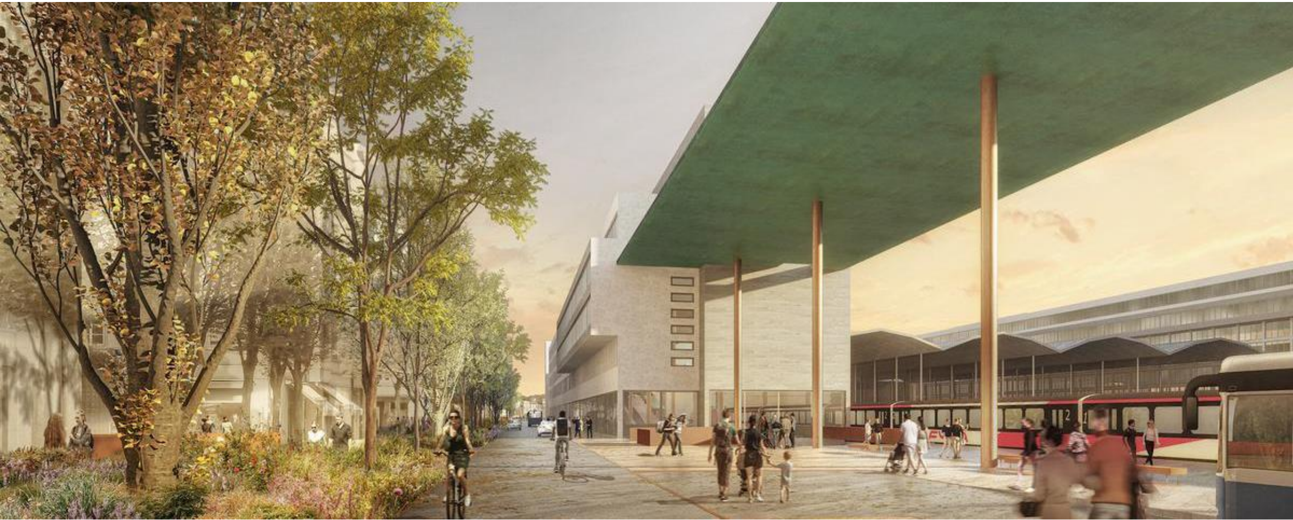
Neuer Bahnhofplatz an der Zentralstrasse in Luzern - Visualisierung von 2021 (Team Güller Güller, Atelier Brunecky, Zürich)